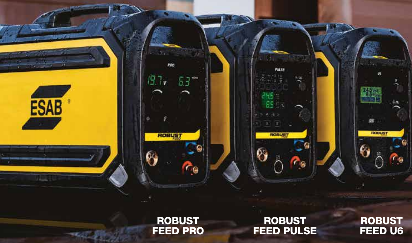
ROBUST FEED PRO