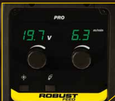
ROBUST FEED PRO