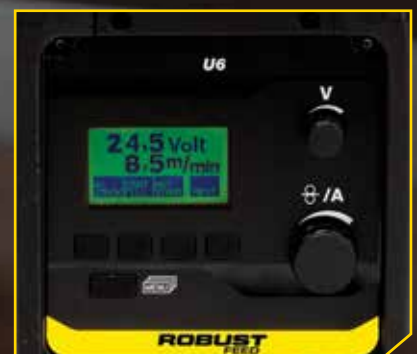
ROBUST FEED U6