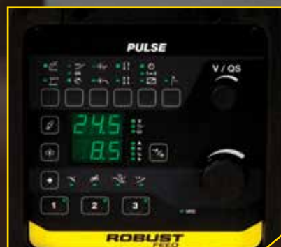
ROBUST FEED PULSE