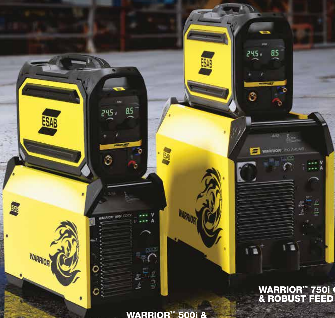
WARRIOR™ 750i CC/CV & ROBUST FEED PRO

简单易用 - 清晰直观的用户界面，旋钮大而灵敏，即便佩戴防护手套也能快速准确调节参数。